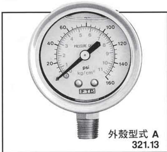
外殼型式 A 321.13