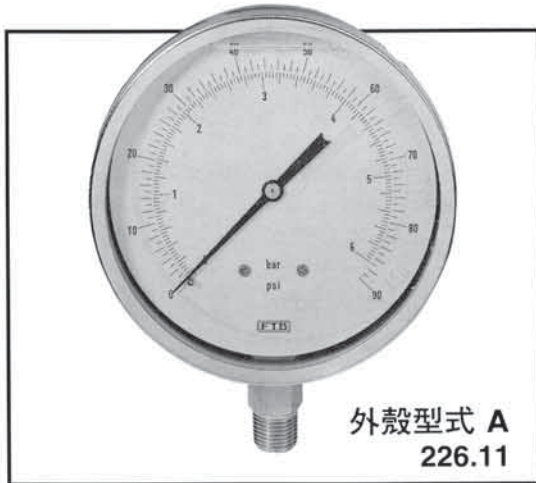
外殼型式 A 226.11