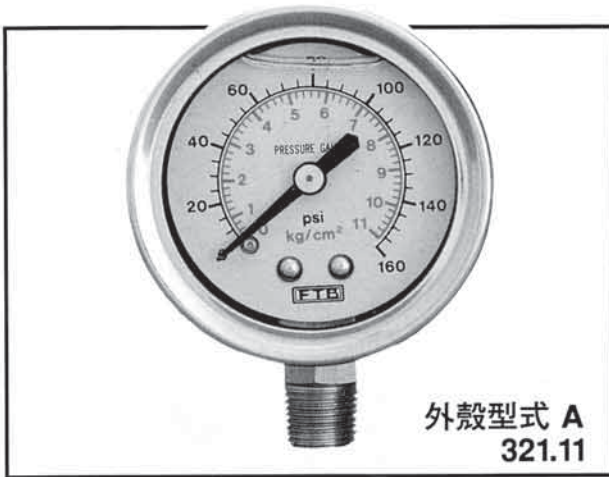
外殼型式 A 321.11